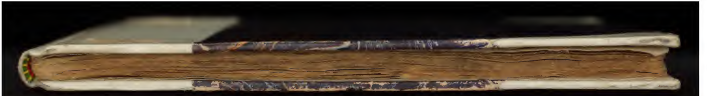
227 E 19